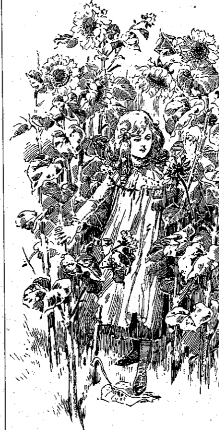
«Εὐρέθη μέσα στὰ ἡλιοτρόπια.» (Σελ. 61, στήλ. 6'.)

— Τώρα ὁμως, ἐξηκολούθησεν ὁ Ἡλιος, ἐγὼ πρέπει νὰ πηγαίνω, διότι εἶ-